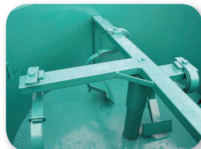
Racloir monté sur système à ressort