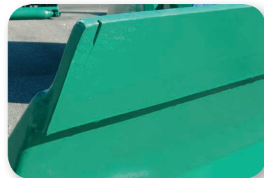
Lame réversible pour le raglage du sable, de la terre...