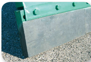
Joint caoutchouc boulonné interchangeable