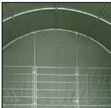
Détail structure arrière