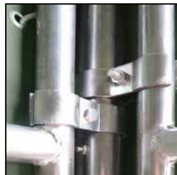
Tubes et fixation de la structure

BEISER Environnement Domaine de la Reidt • 67330 BOUXWILLER