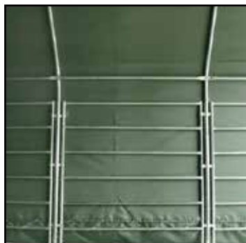
Détail structure latérale