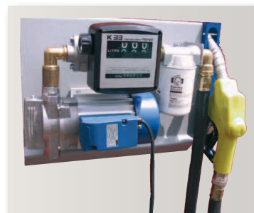
Pumpe 100 l/min