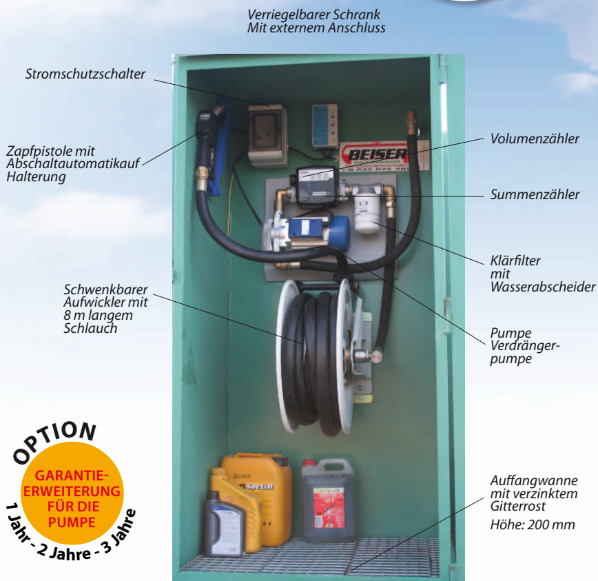
Verriegelbarer Schrank Mit externem Anschluss